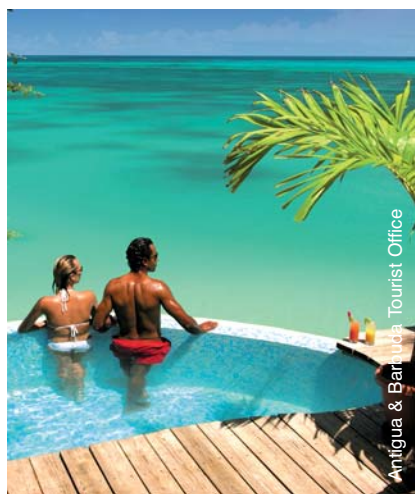
Antigua & Barbuda Tourist Office