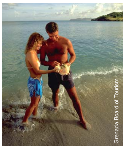
Grenada Board of Tourism