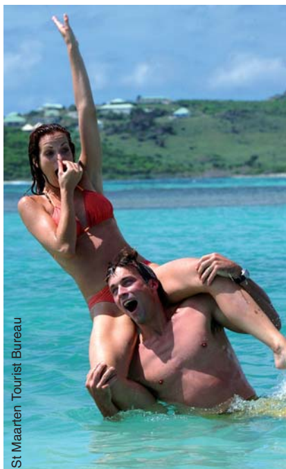
St Maarten Tourist Bureau

Queste scelte sono supportate anche dalla graduale trasformazione che sta investendo il periodo delle partenze nozze, non più concentrate solo in primavera, ma in coincidenza delle vacanze estive (maggio viene più che volentieri agganciato a giugno, o agosto a settembre), per via delle maggiori difficoltà economiche o dei rapporti di lavoro atipici oggi in voga.