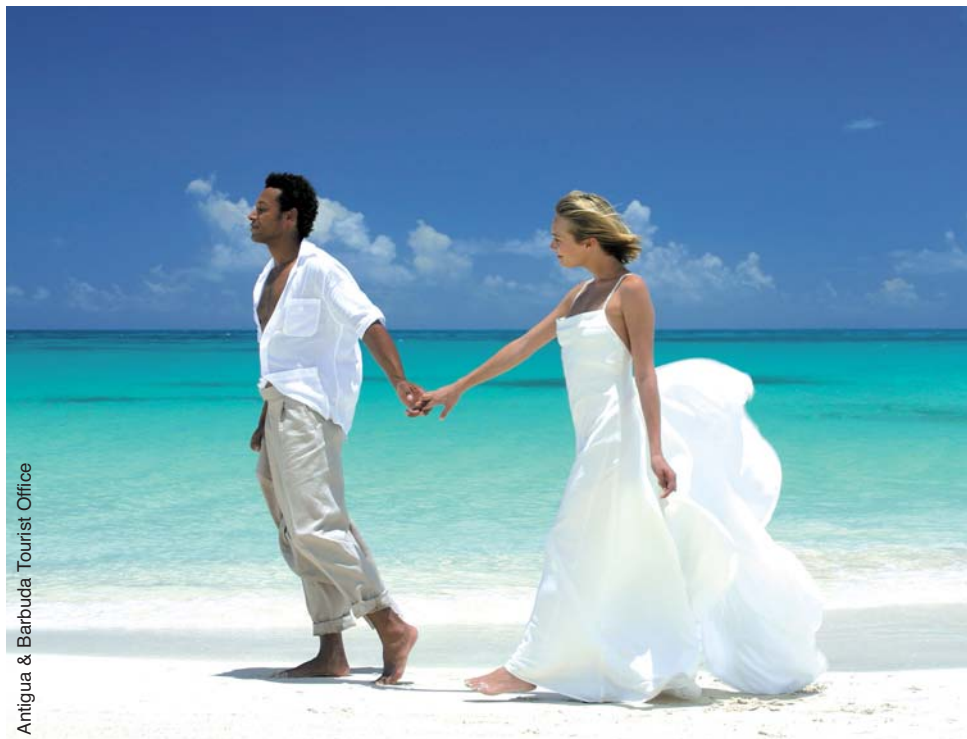
Antigua & Barbuda Tourist Office

Largo dunque d'offerte che prevedano la gratuità della sposa, così come a riduzioni durante