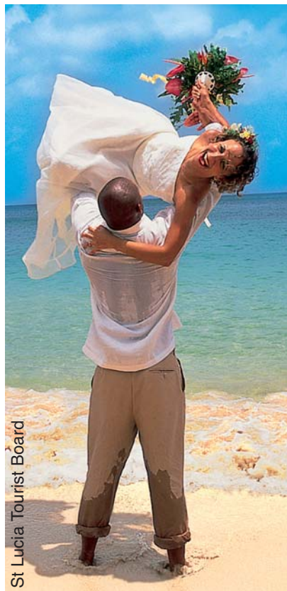
St Lucia Tourist Board

Non a caso chi opera nel settore dei viaggi di nozze sta puntando piuttosto su un nuovo strumento di fidelizzazione della coppia, ovvero la creazione di "video guestbook": sorta di raccogliitore digitale di messaggi, auguri e pensieri di tutte le persone che sono state coinvolte nello spozalizio. Altro asso nella manica si rivela il viaggio solidale, al quale sempre più coppie appaiono sensibili, nonostante i voli onirici siano spesso costretti a tornare coi piedi per terra, trasformando le nozze in un'occasione di sensibilizzazione, ancorché di puro divertimento: punto di riferimento, in questo caso, è il gruppo Hotelplan, che già da anni ha creato un apposito sito ( www.lunadimelesolidale.it ), all'interno del quale è possibile dirottare parte del budget nozze verso Onlus di qualsiasi tipologia.