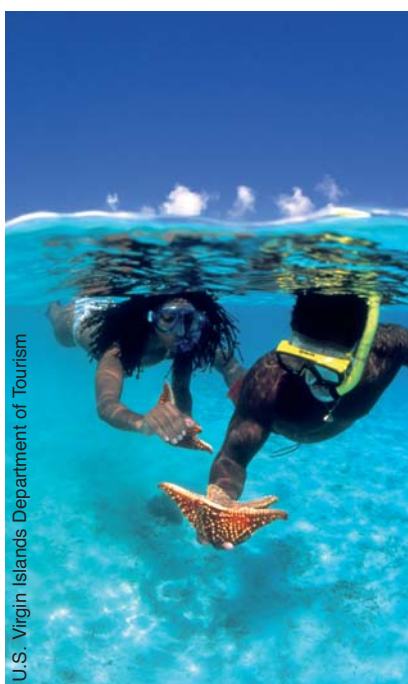
U.S. Virgin Islands Department of Tourism