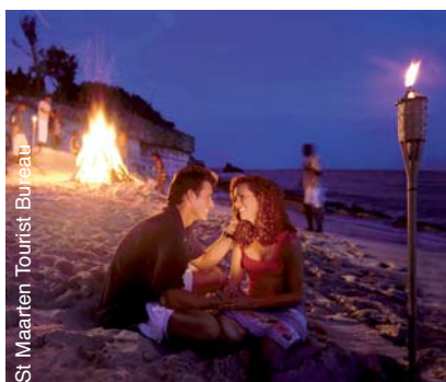
St. Maarten Tourist Bureau