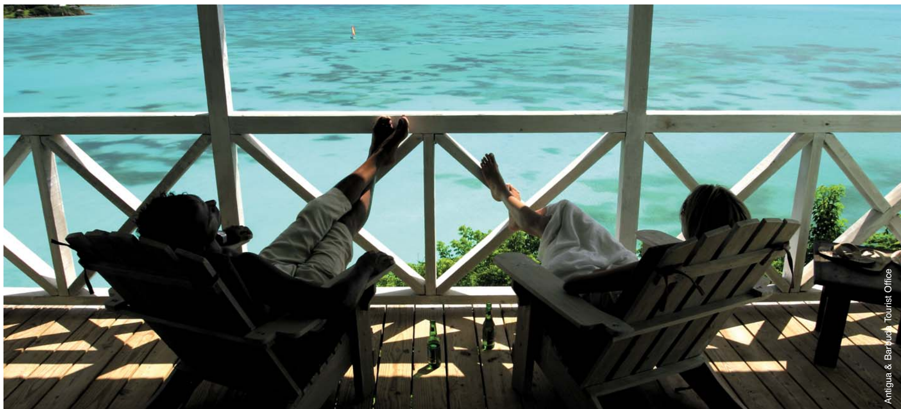
Antigua & Barbuda Tourist Office